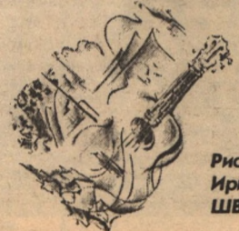
Рисунки Ирины ШВЕДОВОЙ

Мне же прости ты мое нетерпение - Осень уходит и медлит опасно. Я не прошу у тебя вдохновения, Дай только веры, что все - не напрасно.