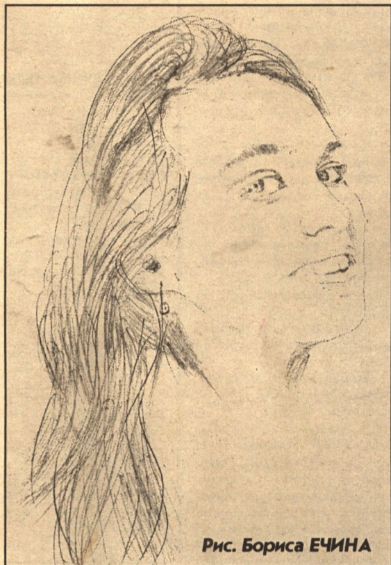
Рис. Бориса ЕЧИНА