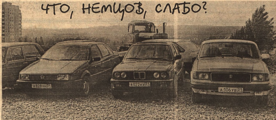
Возле госучреждений города, на автостоянках, рядом с "Вольво" и "Мерседесами" все чаще можно видеть трактора. И все наши, отечественные, на гусеничном ходу.