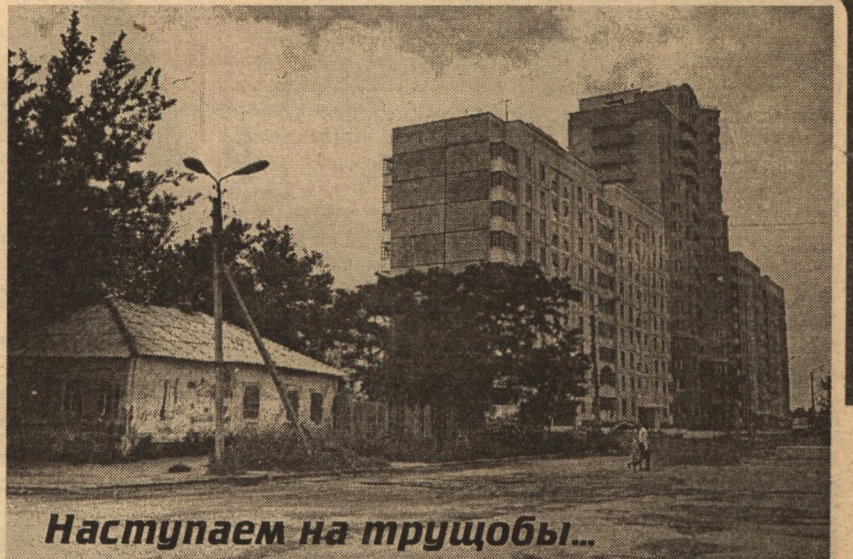
Наступаем на трющобы...