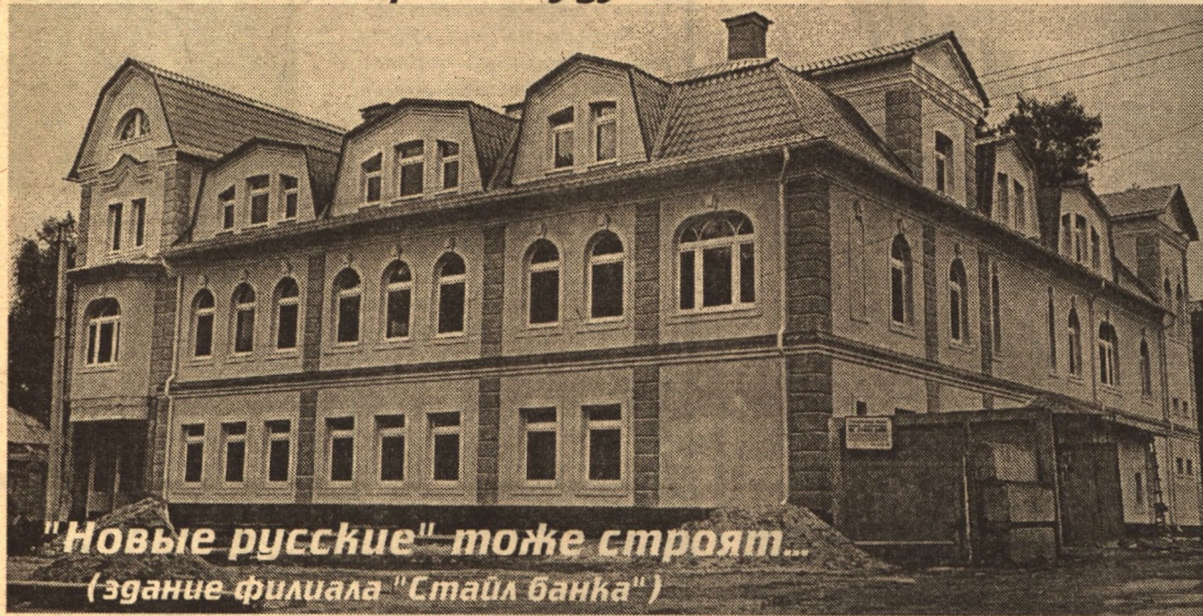
"Новые русские" тоже строят... (здание филиала "Стайл банка")