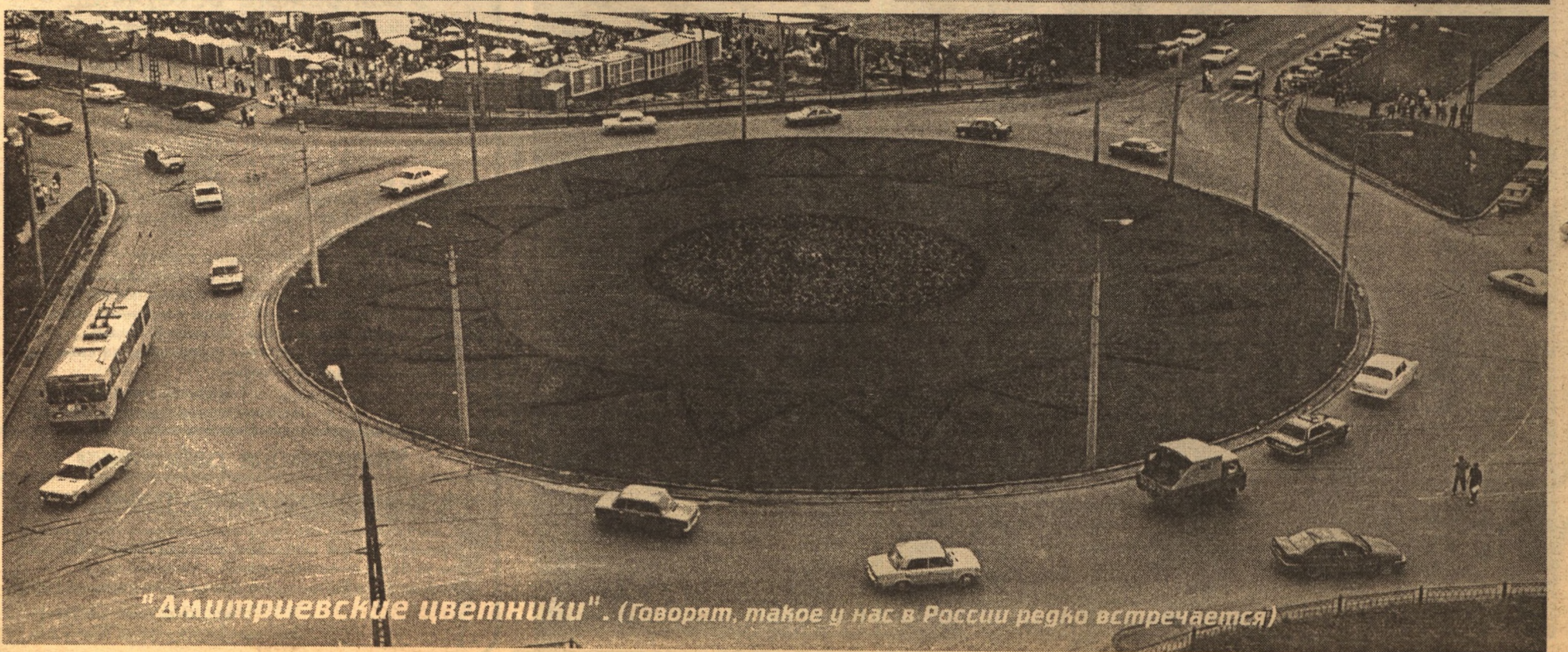
"Дмитриевские цветники". (Говорят, такое у нас в России редко встречается)