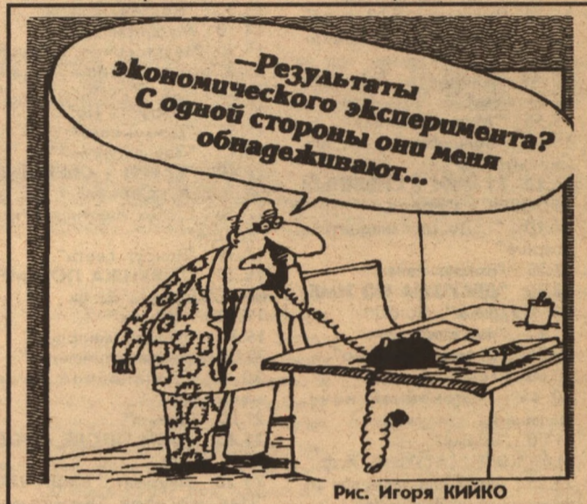
Рис. Игоря КИЙКО

29 мая при большом стечении болельщиков прошла решающая игра на Кубок Белгорода 1997 года. Встрелились команды "Динамо" и "Энергомаш". Удача на сей раз оказалась благосклонна к заводчанам — они выиграли 4:3 по пенальти. Итак, "Энергомаш" в четвертый раз за свою историю стал чемпионом города.