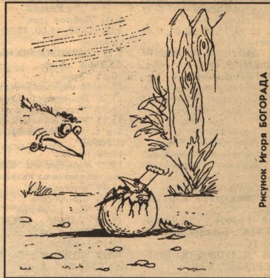
Рисунок Игоря БОГОРАДА