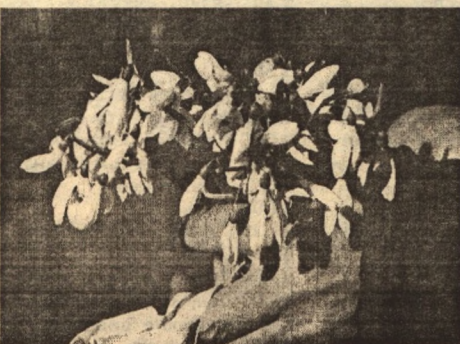
В среднем каждую неделю на Земле исчезает один вид растений.

Приход весны неизменно ассоциируется у нас с первыми весенними цветами - подснежниками. В наших краях подснежником ошибочно называют голубую пролеску сибирскую, в большом (пока еще!) количестве украшающую поляны в весеннем лесу.