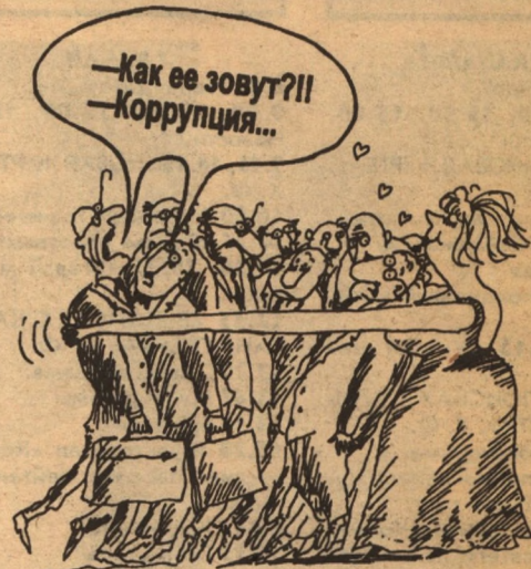
Рисунок Игоря БОГОРАДА