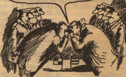
Рисунок Игоря БОГОРАДА