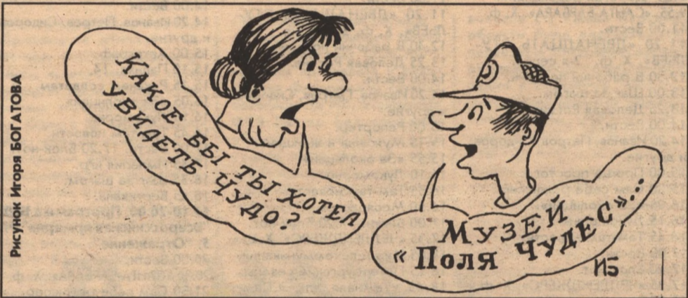
Рисунки Игоря БОГАТОВА