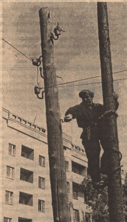
СЛАЗЬ СО СТОЛБА

Отключение электроэнергии потребителям, которые задерживают плату за ее пользование, стали практиковать руководители южных электрических сетей.