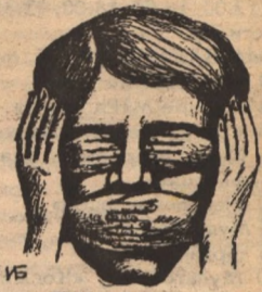
Рис. Игоря БОГАТОВА