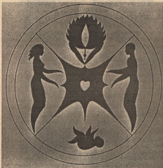
Рис. Владимира КУТЯВИНА