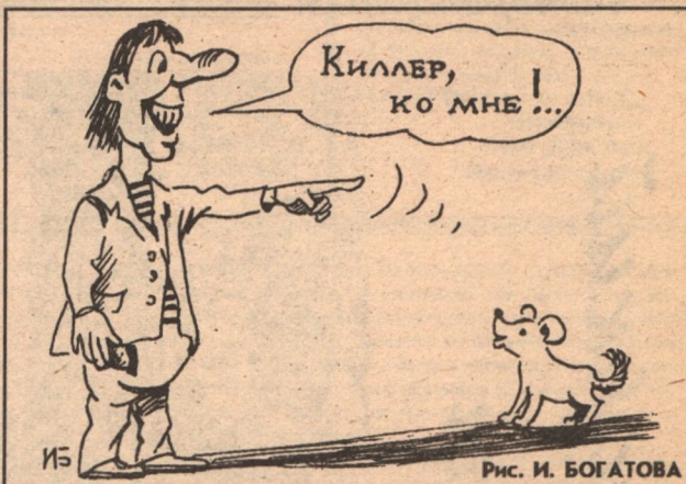
Рис. И. БОГАТОВА

такой ножичек вам обойдется в семьсот тысяч. С чехлом, кровостоком и заклелками. Вот уж воистину - настоящая мечта душегуба.