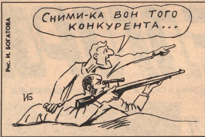
Рис. И. БОГАТОВА

хорошее и авансом на будущее. Факт, безусловно, печальный, говорящий о нашей общей высокой культуре откровенного хамства. К сожалению,