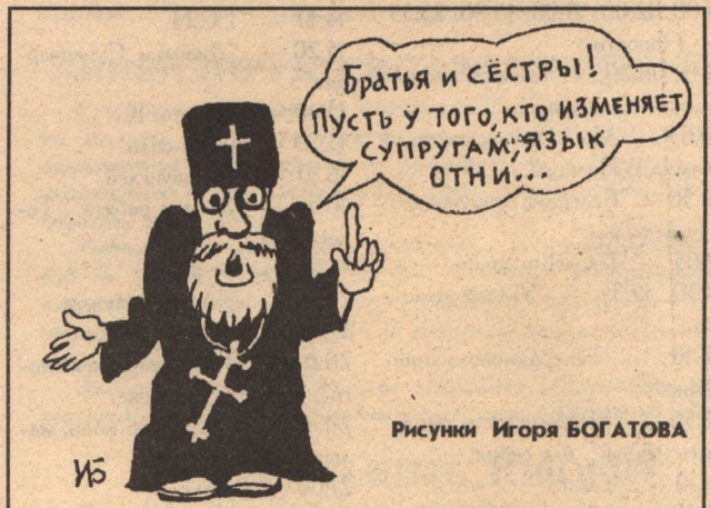
Рисунки Игоря БОГАТОВА

По вертикали: 2. Река. 3. Матадор. 5. Обет. 6. Аист. 7. Намаз. 8. Бездарь. 9. Парча. 12. Нахал. 15. Рикшет. 16. Единомыслие. 17. Уралец. 18. Агама. 20. "Бэла". 22. Богема. 24. Геноцид. 30. Юнг. 31. Яичница. 33. Вавилон. 34. Левша. 38. Азот. 40. Оникс. 41. Факел. 43. Анонс. 46. Фетр. 50. Ти. 52. Ра.