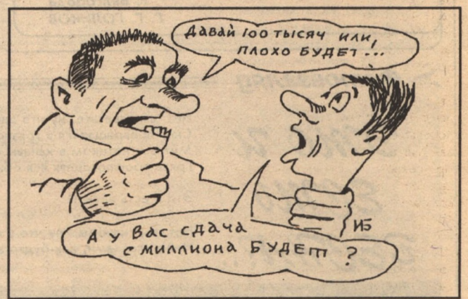
Рисунки Игоря БОГАТОВА