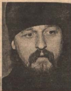
БОРИС ЕЧИН. Фото автора.

Восьмого декабря в помещении городской избирательной комиссии совершил тайное голосование Иоанн - епископ Белгородский и Старооскольский.