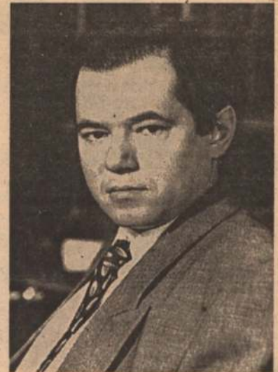
ГЛАЗЬЕВ С. Ю.