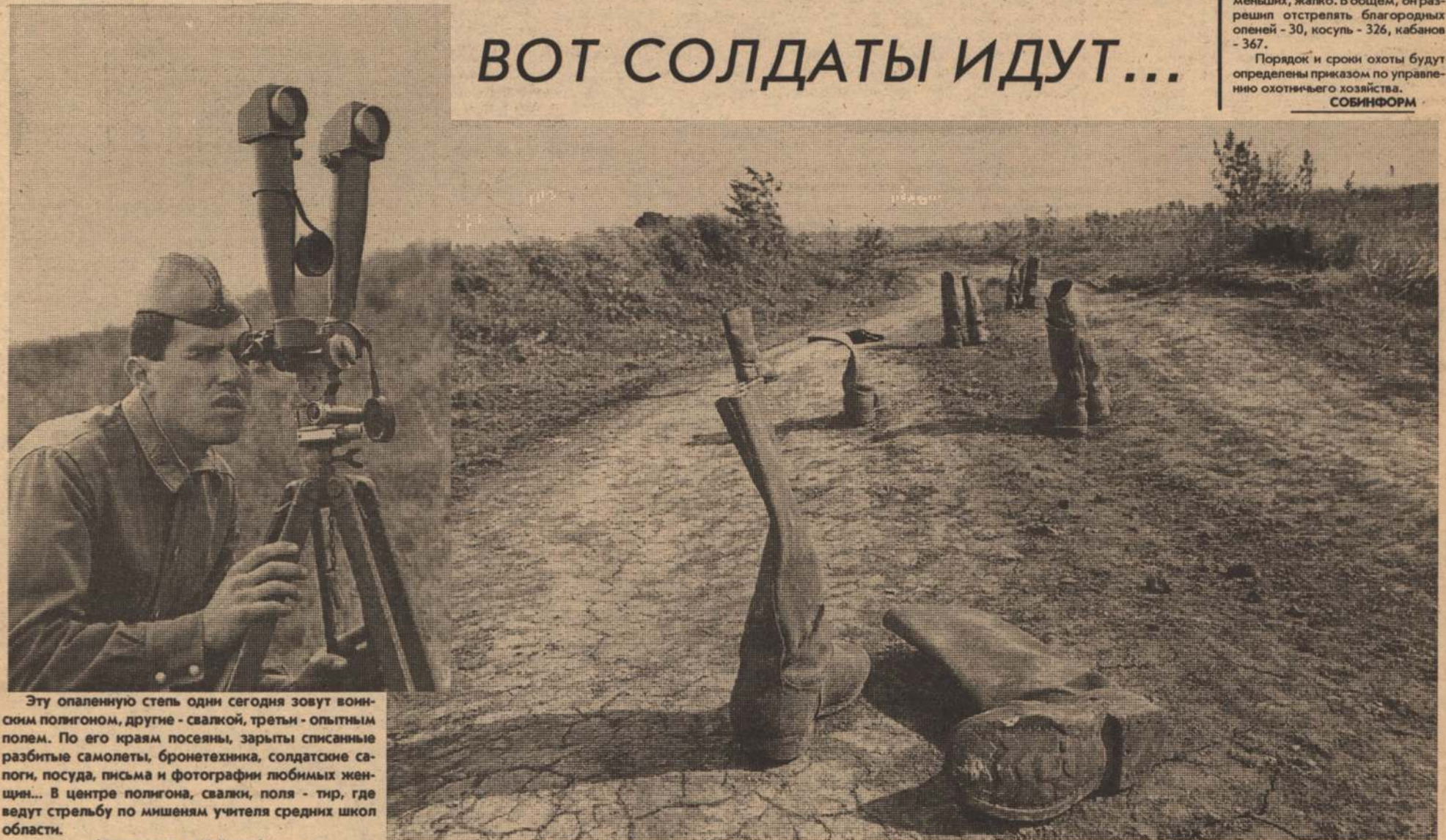
Эту опаленную степь одни сегодня зовут воинским полигоном, другие - свалкой, третьи - опытным полем. По его краям посеяны, зарыты списанные разбитые самолеты, бронетехника, солдатские сапоги, посуда, письма и фотографии любимых женщин... В центре полигона, свалки, поля - тир, где ведут стрельбу по мишеням учителя средних школ области.