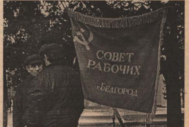
Провести митинг 3 октября 1995 года около ДК "Энергомаш" в Белгороде оказалось сложнее, чем путч 3 октября 1993 года в Москве.