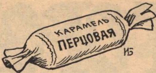
Рисует Игорь БОГАТОВ