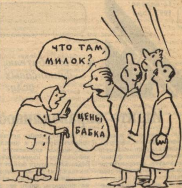
Рисует И. Богатов