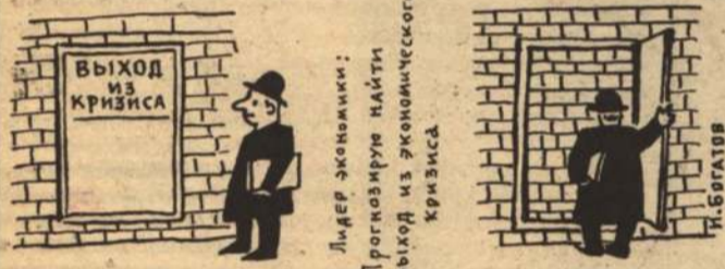
Лидер экономики: Прогнозируем найти выход из экономического кризиса