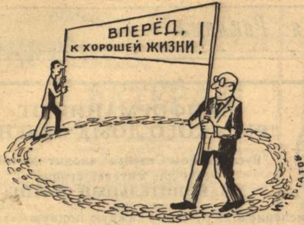
Политики: - Прогнозируем привести народ к счастью и процветанию!..

Муж приходит домой и застаёт жену с любовником. Муж тут же достаёт пистолет. Жена ему говорит: