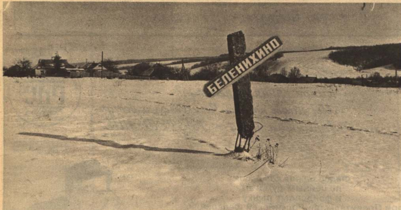
«Барское место» — где в 1918 году находился помещичий сад и были зарыты (предположительно) расстрелянные и изнасилованные на станции «Беленихино».