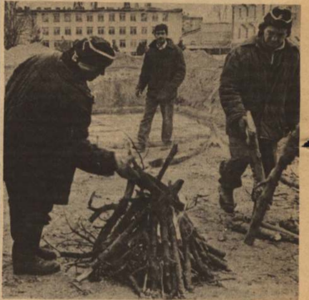
Все больше и больше вызывает у жителей улицы Ленина пропагандистская собственность КПСС желание унести ее по частям на дачу.