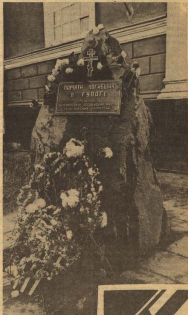
Борис ЕЧИН.