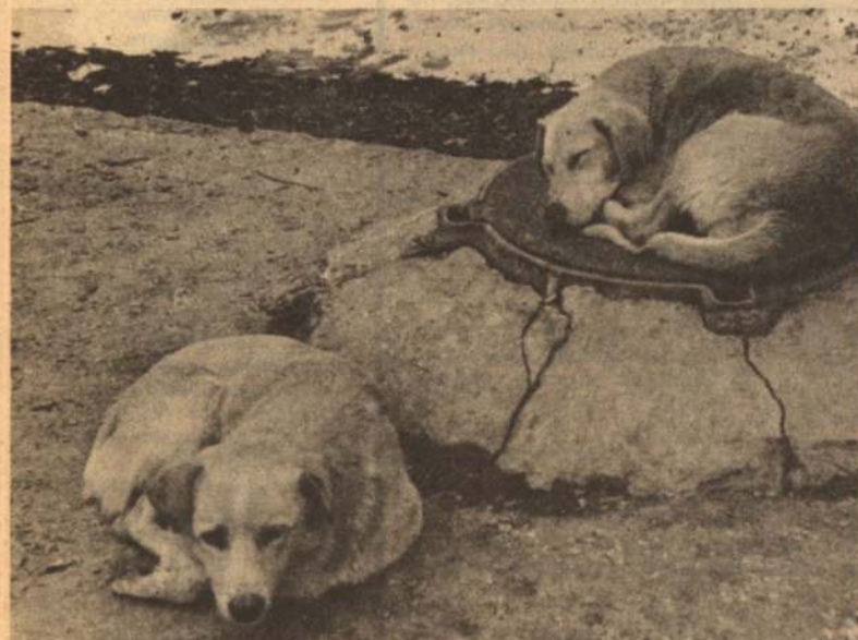
Тепло, но не всем...