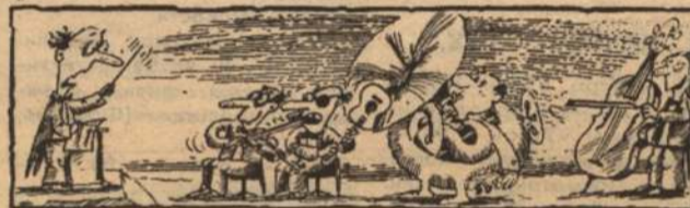
Рис. С. ПАСКОВАЛОВА.