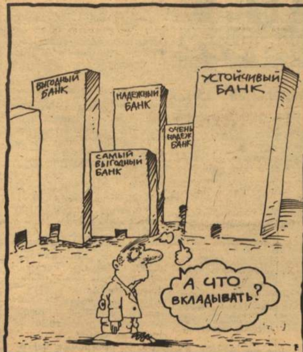
Рисунок Сергея РАСКОВАЛОВА.