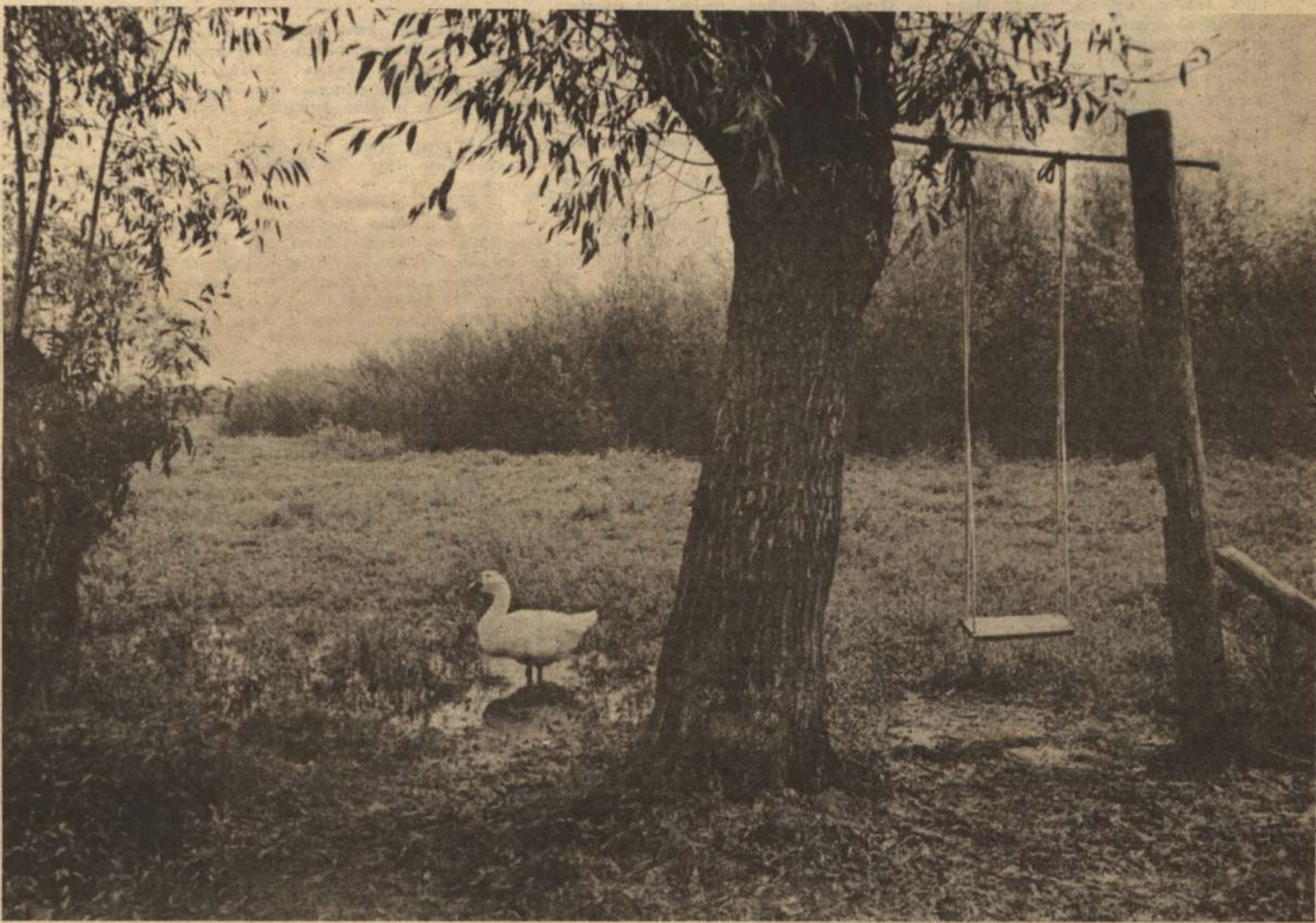
Заросла река, дальше нет пути, Расправляет крыло и вперед лети.

бя писательскому делу, поэзии, но понимаю, что этим семью не прокормишь.