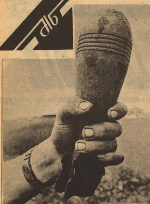
Именно такой, старой, найденной в поле через 49 лет после войны, с виду разряженной, противопехотной миной решил «развеселить» свою жену и соседку житель села Мелехово Корочанского района... Как сообщили в областном военкомате, это уже второй трагический случай за этот месяц, и спастись от собственной глупости никому еще не удалось.