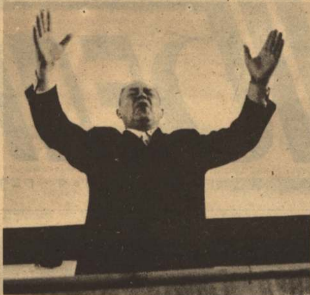
Да, у нас уже пять действующих православных церквей, одиннадцать христианских сект, около ста священников и проповедников. Тогда зачем к нам в город снова приезжает Перри Паркс? Но это известно только господу Богу.