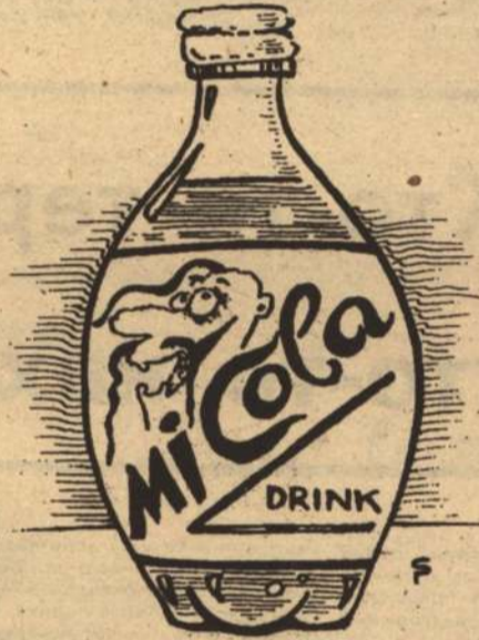
ТЕМА - Е. Крайской

Отдел защиты прав потребителей территориального управления по антимонопольной политике Белгородской области (пл. Революции, Дом Советов), телефон 2-04-17.