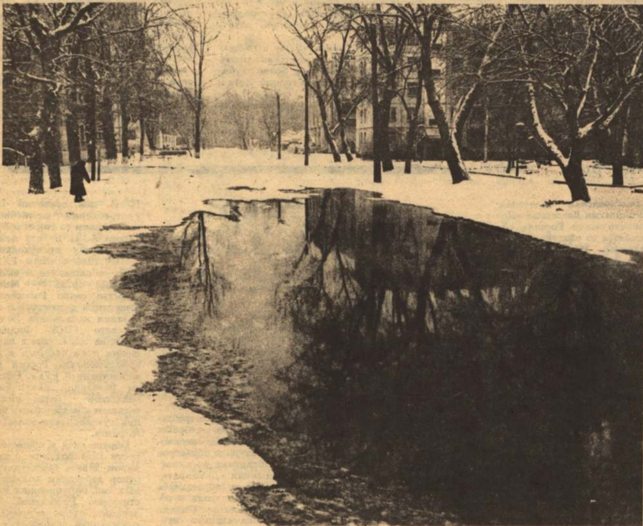
Зима. Улица Воровского сошла с ума.