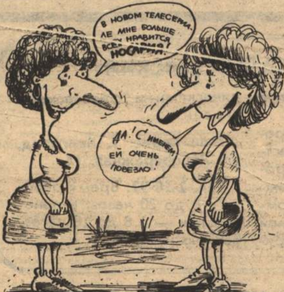
Рис. С. Расковалова