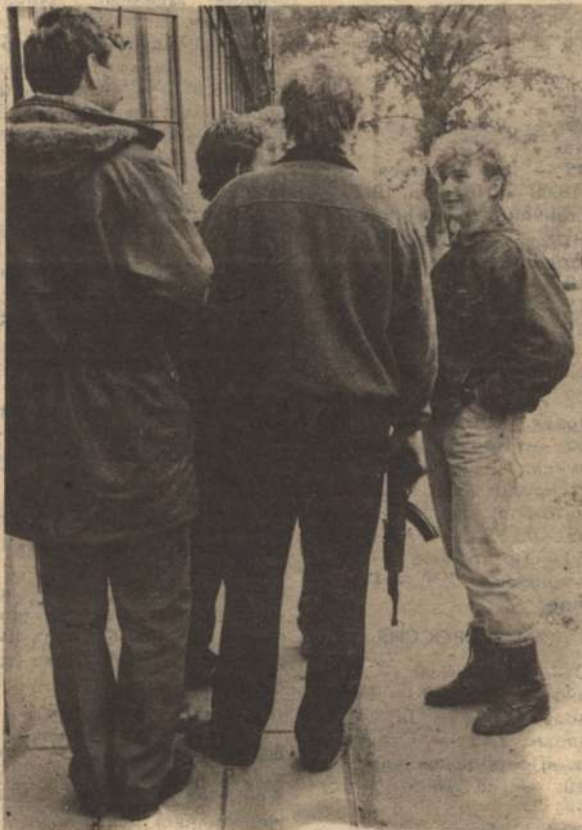
Белгород и белгородцы