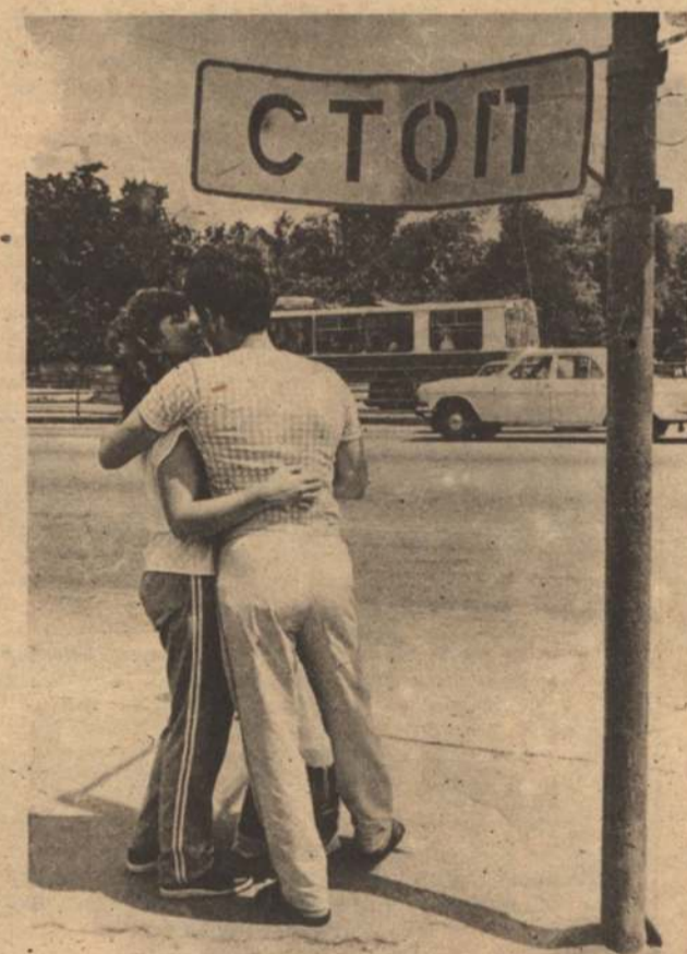
Любовь — налево