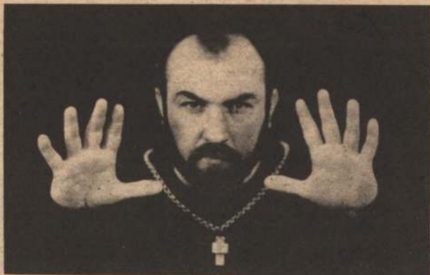
Дворец культуры «Строитель» — 21—22 мая 1993 года ЧУДЕСА ИСЦЕЛЕНИЯ

Выдающийся парапсихолог, равных которому нет ни на родине, ни за рубежом. Это имя на устах миллионов, в народе о нем слагают легенды.