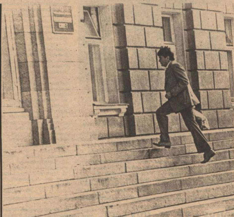
Вверх к вершинам власти через три ступеньки.