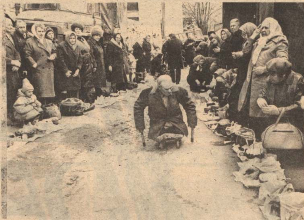
«Патриотизм — последнее прибежище сволочи», — прочитал я недавно одну из последних записей в дневнике Льва Николаевича Толстого и, пораженный, задумался: что хотел он этим сказать, когда имел в виду? Может тех, кто сейчас в наше время в газетах и на митингах

бьет себя в грудь, кричит о любви к Отечеству, спасении народа!