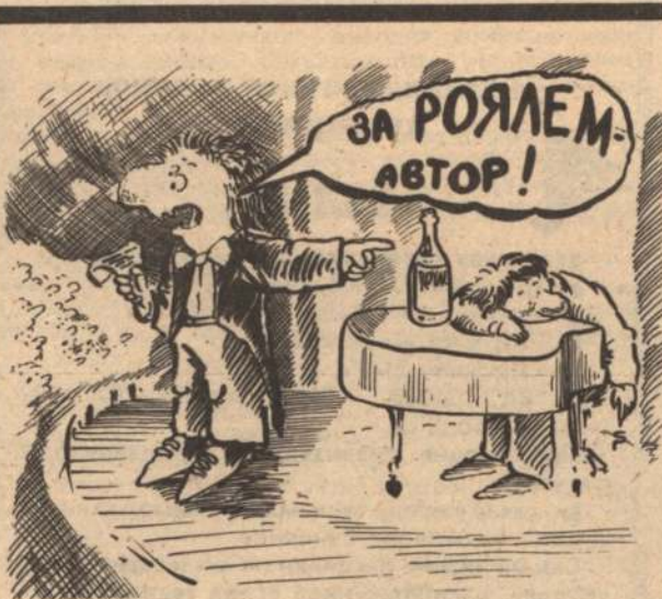
Рисунок Сергея Расковалова.

Реализует карбид, стиральные машины «Донбасс», мед, тушенку, шампанское. Оказывает услуги грузовым автотранспортом и автомобилями. Тел. в Белгороде: 1-47-70, 1-46-35.