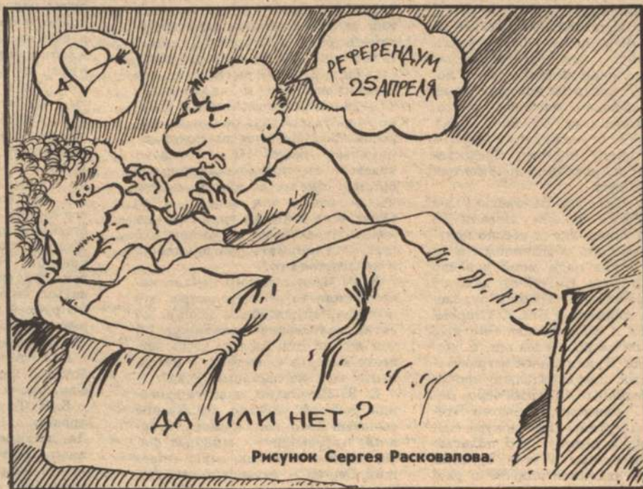
Рисунок Сергея Расковалова.

В условиях предстоящего референдума, мы, предприниматели области, — участники совещания — были и остаемся убежденными сторонниками реформ, уверены, что Россия должна развиваться путем совершенствования цивилизованных рыночных отношений, направленных на максимальное раскрытие огромных потенциальных возможностей Российского государства.