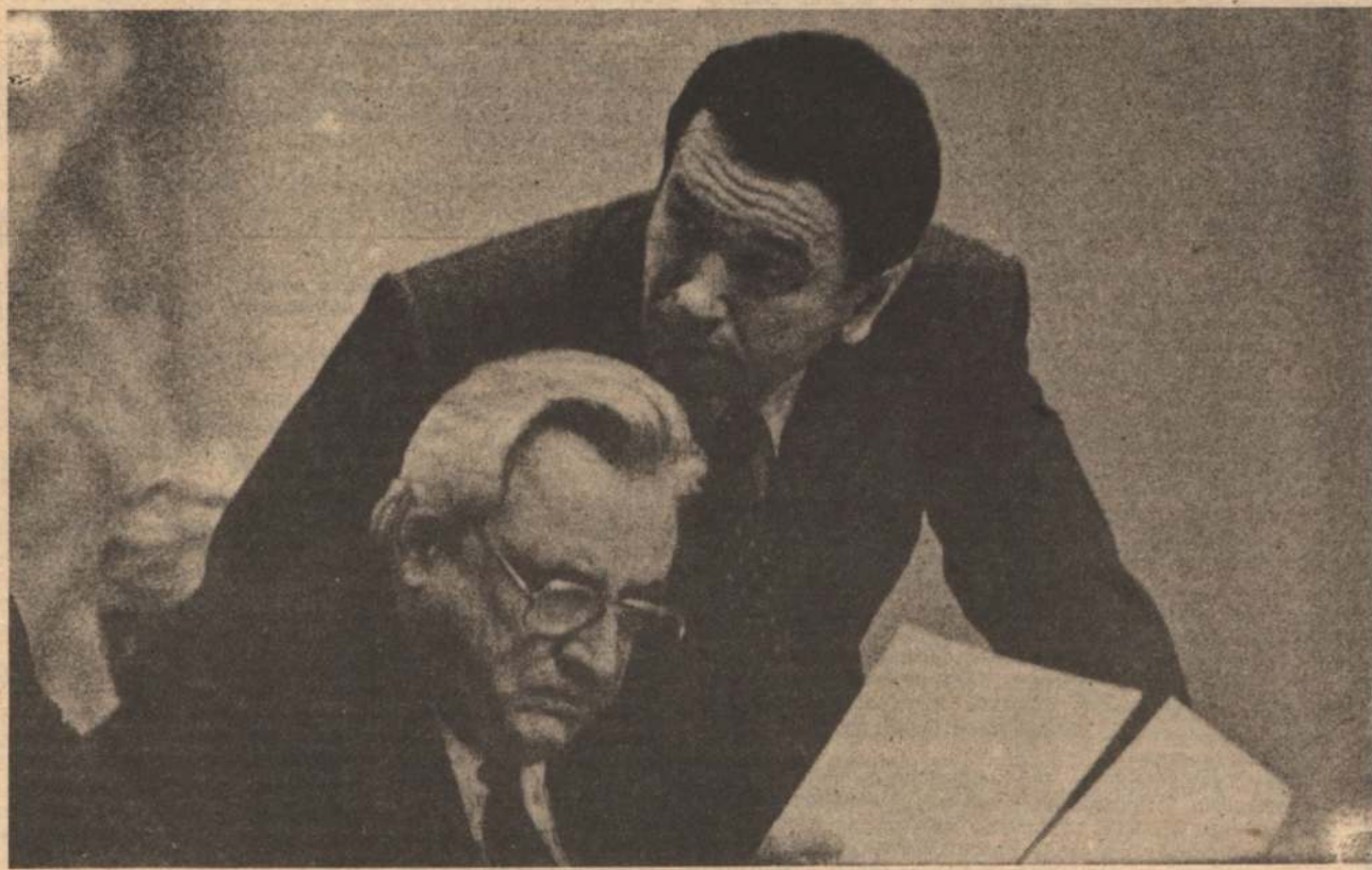
ПОСОВЕТУЕМСЯ... «Есть надежда, что и профсоюзы нас поддержат» (из «Белгородской правды»).

«Профсоюзы — школа коммунизма!» И... глаза и уши партии!