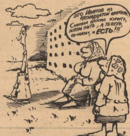
Рисунок Сергея РАСКОВАЛОВА.