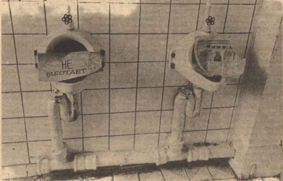
Интересно: где это, у кого, кто и что не работает!