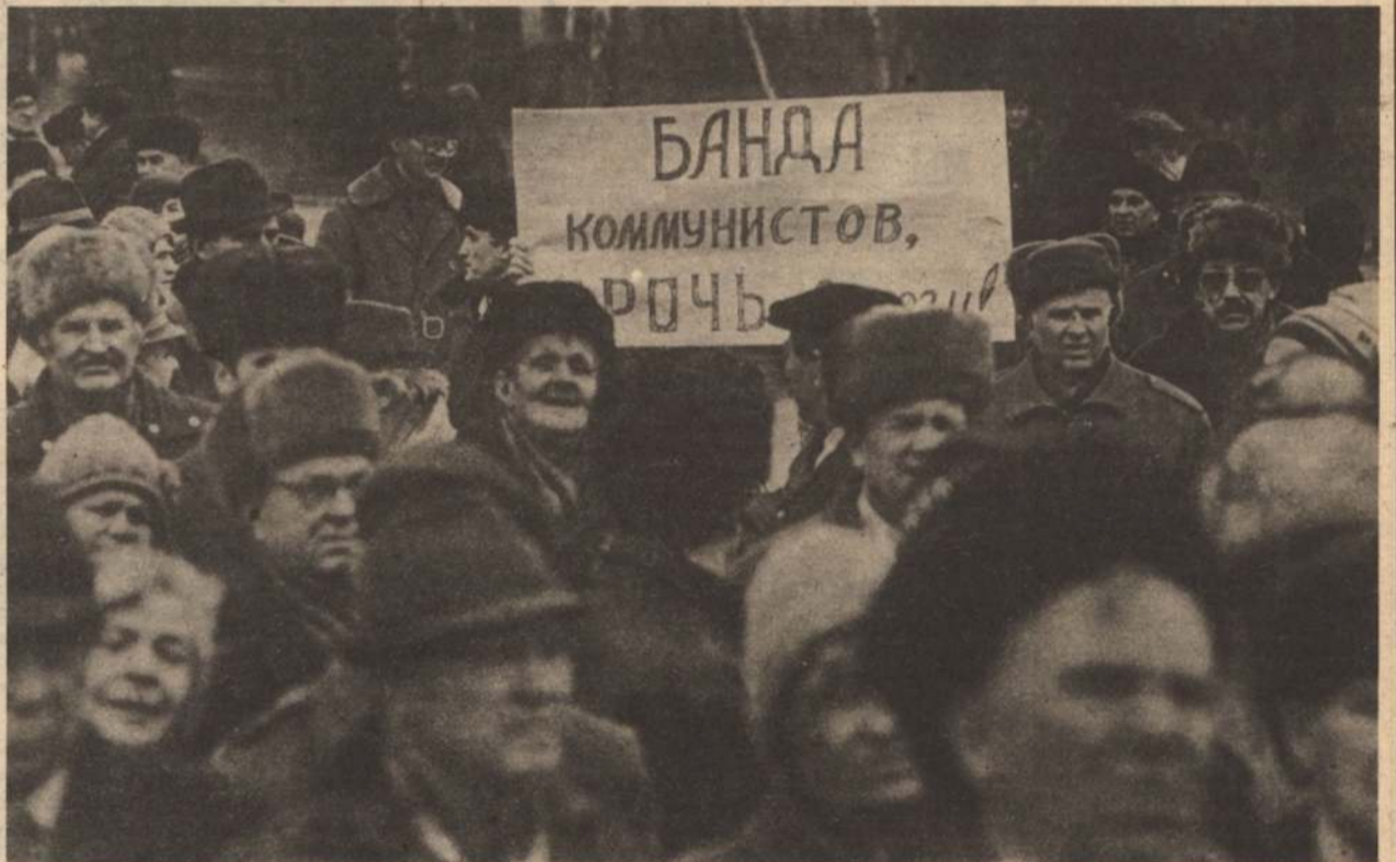
На снимке: митинг у ДК «Энергомаш».