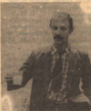
И еще раз «кстати». Вышел обновленный номер газеты «Приват-аукцион». Тоже неплохая газета. Поздравляем редакционный коллектив. КОЛЛЕКТИВ «НБ».