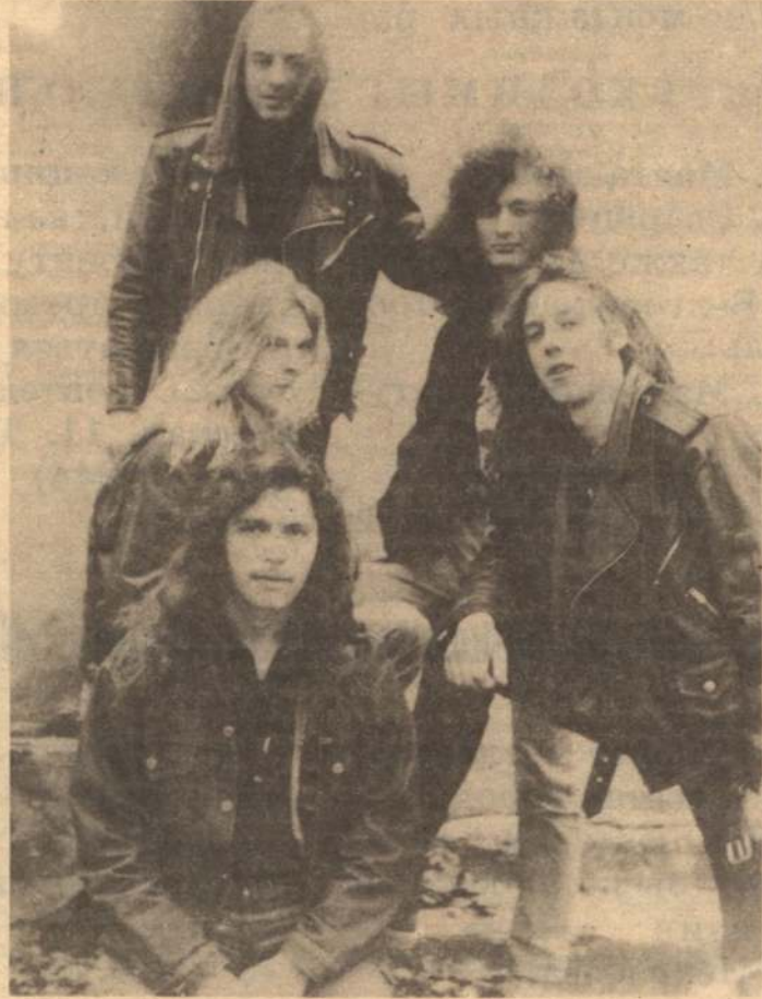
Железные хлопцы (русс.) «Крезатор» (англ.)

Газета — это такой же рынок, как и все остальное. И не может она быть нормальной без изучения читательского спроса. До сих пор еще альма мать наша (сиречь — «НБ») свято уверена, что в Белгороде масса любителей рок-н-ролла, что им интересна музыкальная информация, что у «Роллера» — огромные тучи поклонников. Но эта вера — голословна, не подтверждена фактами. Давайте не оставаться равнодушными! Ведь нам работать впустую — тоже никакого кайфа. Что интересует вас, о чем бы хотели узнать? Или чего вам и знать не надо? Напишите нам, не молчите! От ваших писем зависит периодичность выхода «Роллера». И, в перспективе, будет и «Роллер» нормальным еженедельным изданием на четырех и более страницах. Ужасили! Тогда хватайте авторучки и — вперед!