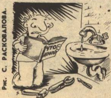
Рис. С. РАСКОВАЛОВА.

за сентябрь не превышал размера прожиточного физиологического минимума — 2208 рублей (в сентябре). Инструкции о том, каким образом будут перенесены пенсии в дальнейшем, должны поступить в ближайшие дни. Скорее всего, будет проводиться поквартальное индексирование. Вопрос о дотации на хлеб и молоко решено передать на рассмотрение горрайадминистрации (т. е. будут учитываться конкретные условия жизни малообеспеченных, а не только доходы и прожиточный минимум). Во всяком случае, решение главы администрации области о выплате дотаций малообеспеченным действует до конца года.