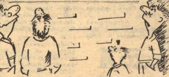
Рис. С. РАСКОВАЛОВА.