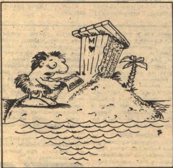
Рис. С. РАСКОВАЛОВА.

ПРОДАЕТСЯ новое пианино. Телефон 5-61-05 после 18.00 час.