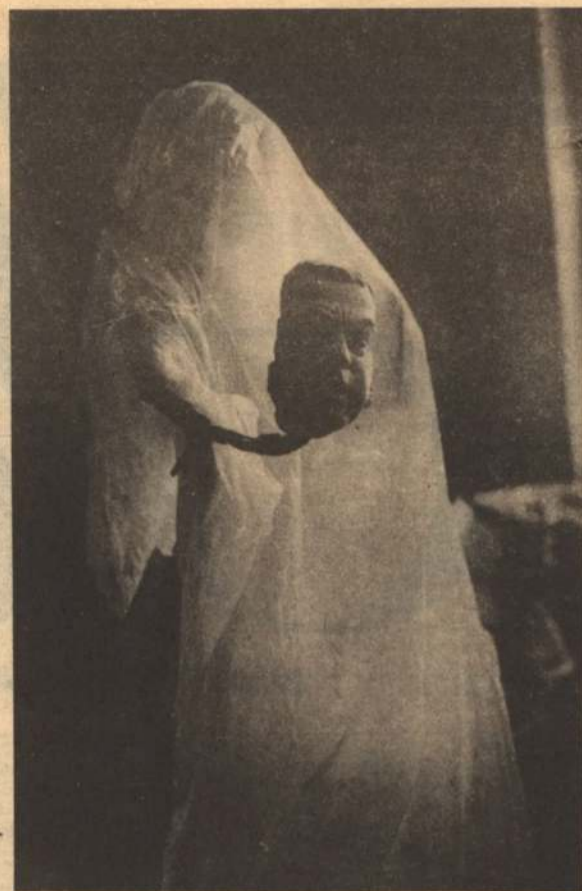
ПУТЧ 1991 ГОДА — ЭТО НЕ ЧТО ИНОЕ, КАК ЗЛОЕ ПРИВИДЕНИЕ, СЧИТАЕТ НАШ ФОТОКОРРЕСПОНДЕНТ БОРИС ЕЧИН