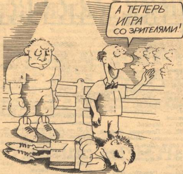
Рис. С. РАСКОВАЛОВА ТЕМА М. СВЕТЛИЧНОГО И Р. ВИЗИРЯКИНА