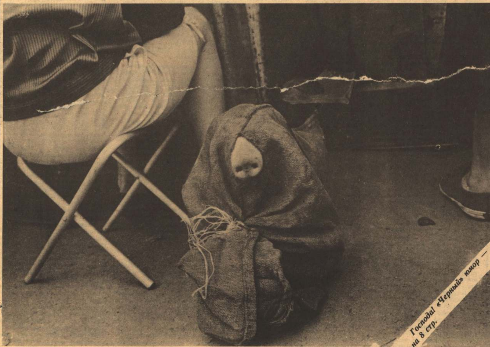
Господи! «Черный» юмор — на 8 стр.