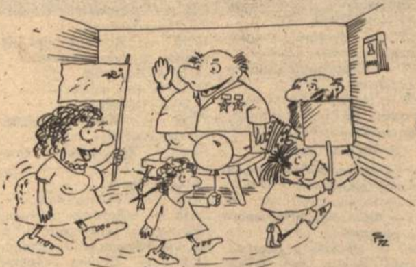
Рисунок С. Расковалова.