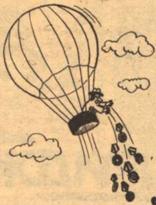
Рисует Александр Панасенко

Сезон цветения деревьев открывает ольха шерстистая, ее соцветия-сережки заметны издали. Малейшее дуновение ветра — ольховые сережки окутаны целыми