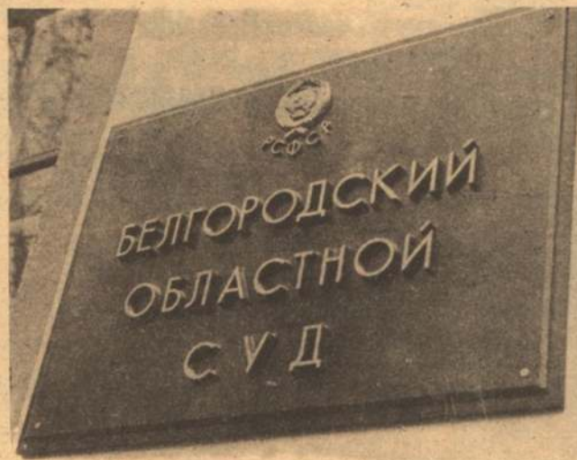
Взгляд со стороны