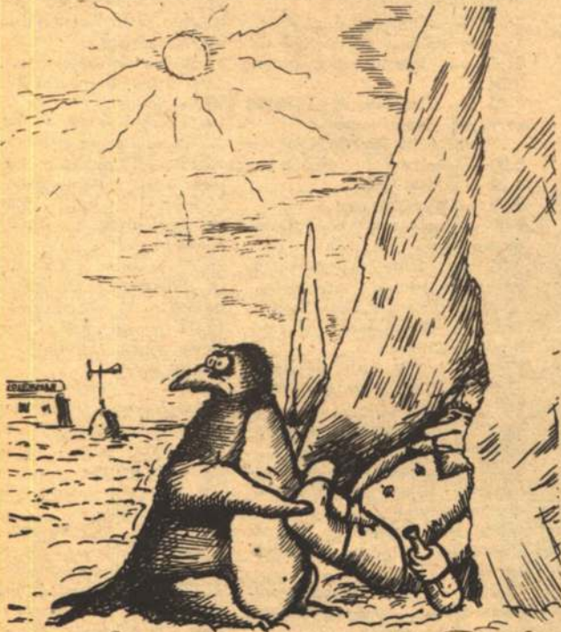
ГЛУПЫЙ ПИНГВИН РОБКО ПРЯЧЕТ ТЕЛО ЖИРНОЕ В УТЕСЕ...

С заявками и предложениями обращаться письменно с обязательным указанием контактных телефонов по адресу: 308001, г. Белгород, а/я 832.