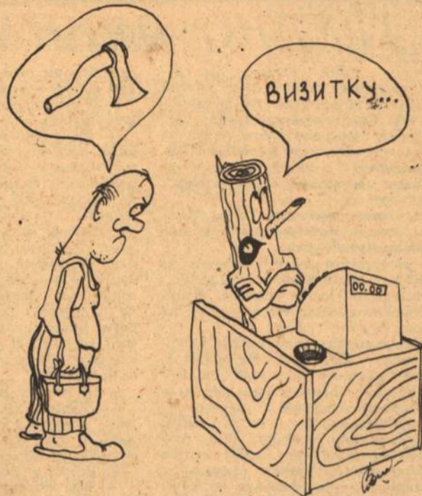
Рис. О. ПОЛОВНЕВА.