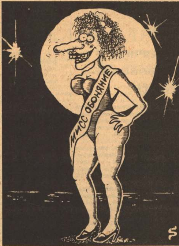
Рис. С. РАСКОВАЛОВА