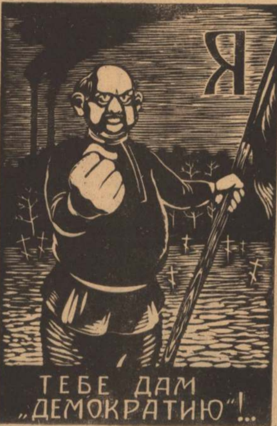
Рисунок М. БАРАНОВА.