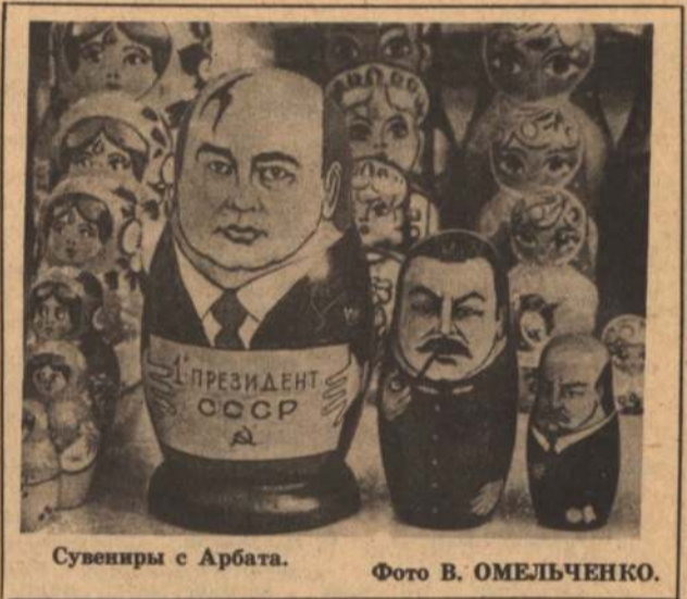
Сувениры с Арбата.