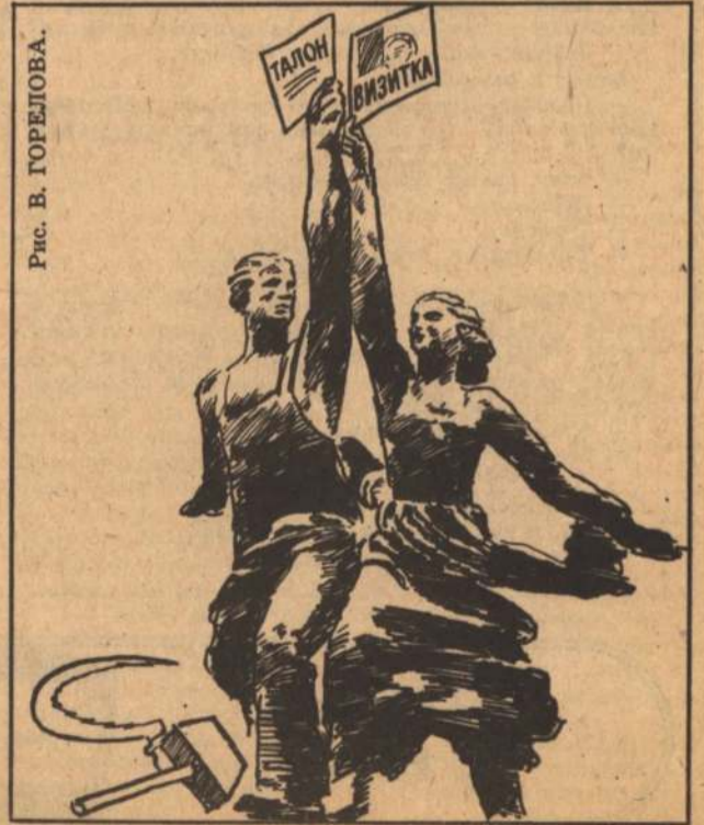
Рис. В. ГОРЕЛОВА.