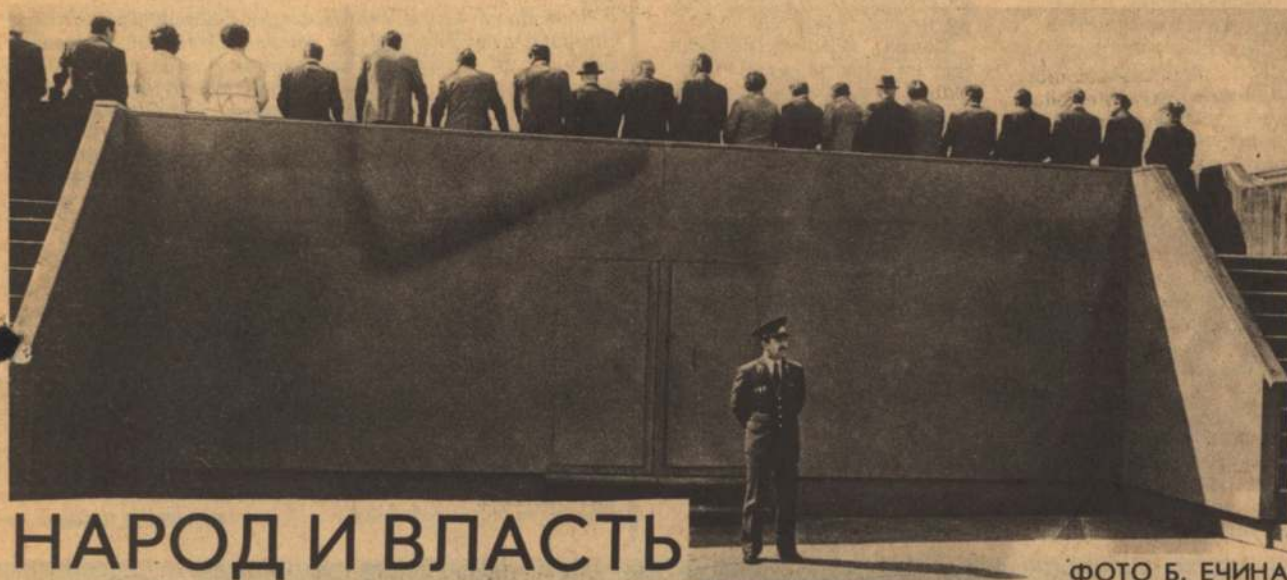
НАРОД И ВЛАСТЬ

ИЗДАНИЕ БЕЛГОРОДСКОГО ГОРОДСКОГО СОВЕТА НАРОДНЫХ ДЕПУТАТОВ